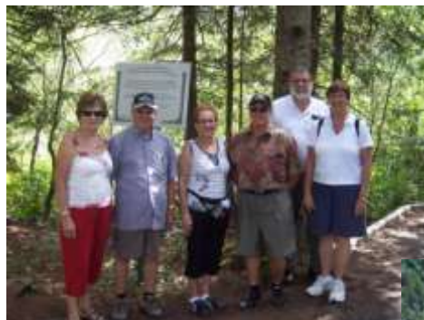
Moulin La Lorraine