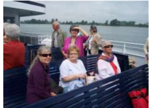
Croisière Montréal Québec