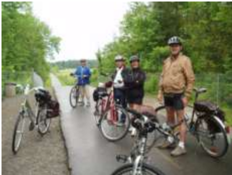
Le p'tit train du Nord