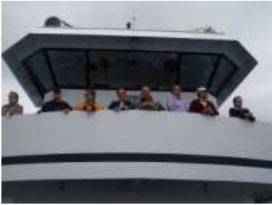
Croisière Montréal Québec