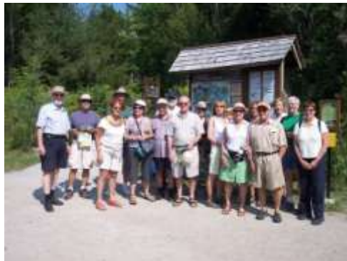
Marais rivière aux Cerises