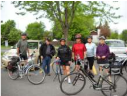
Montée du Fort Chambly