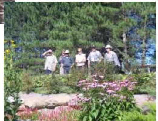
Moulin La Lorraine