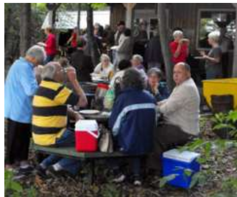
Épluchette de blé d'inde