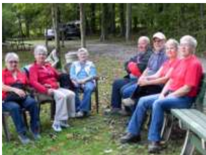
Épluchette de blé d'inde