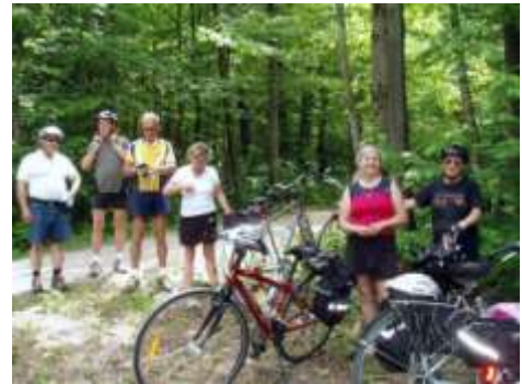
Parc de la Yamaska