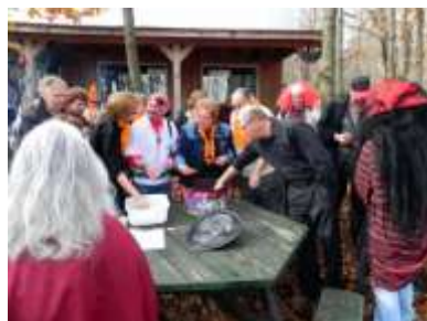
Fête de la citrouille