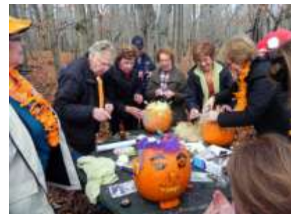
Fête de la citrouille